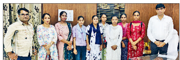
सिरसा। मेजर ध्यानचंद को श्रद्धांजलि अर्पित करती छात्राएं।

सिरसा। राजकीय महिला महाविद्यालय सिरसा में मेजर ध्यानचंद जयंती पर खेल गतिविधियों का आयोजन किया गया।