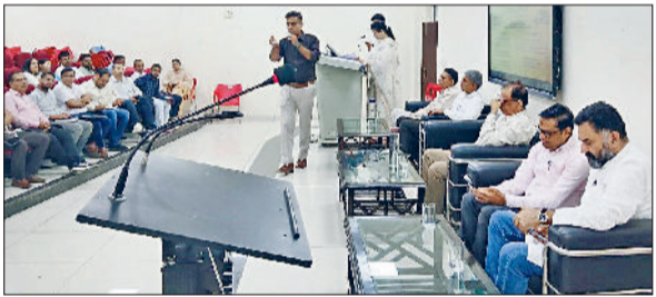
सिरसा। कार्यक्रम को संबोधित करते वक्ता।