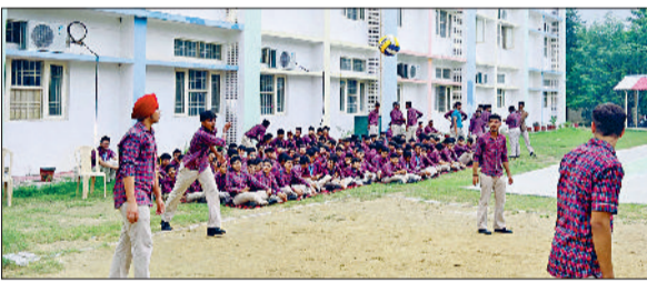
फतेहाबाद। डीएवी पुलिस पब्लिक स्कूल में खेलते छात्र

डीएवी पुलिस पब्लिक स्कूल, फतेहाबाद में राष्ट्रीय खेल दिवस बड़े हॉर्पोल्लास एवं उत्साह के साथ मनाया गया। इस अवसर पर विद्यालय में विभिन्न खेल प्रतियोगिताओं का आयोजन किया गया, जिसमें विद्यार्थियों ने अपनी प्रतिभा, उत्साह और खेल भावना का प्रदर्शन किया। कार्यक्रम की शुरुआत महान हॉकी खिलाड़ी और भारत के हॉकी जादूगर मेजर ध्यानचंद की जयंती पर उन्हें श्रद्धांजलि अर्पित करके की गई। शारीरिक शिक्षा विभाग सहित सभी शिक्षकों एवं विद्यार्थियों ने उनके चित्र पर पुष्प अर्पित कर खेल