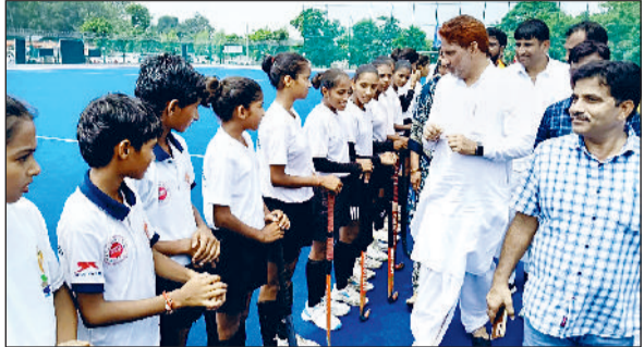
फतेहाबाद। हॉकी एस्ट्रोर्टफ मैदान में फ्रेंडली मैच में दम-खम दिखाते खिलाड़ी व हॉकी एस्ट्रोर्टफ मैदान में फ्रेंडली मैच में खिलाड़ियों का खिलाड़ियों का परिचय करते हुए सांसद सुभाष बराला

राजकीय वरिष्ठ माध्यमिक विद्यालय, बैजलपुर में आयोजित जिला स्तरीय समारोह के दौरान सांसद ने सांसद खेल महोत्सव की पंजीकरण प्रक्रिया का विधिवत शुभारंभ किया। उन्होंने कहा कि यह महोत्सव गांव-गांव की छुपी खेल प्रतिभाओं को एक मंच देगा, जहां खिलाड़ी अपनी काबिलियत दिखा सकेंगे। इसी उद्देश्य से सांसद बराला ने बैजलपुर को 10 लाख रुपये की ग्रांट देने की भी घोषणा की। सांसद ने स्पष्ट किया कि पंजीकरण कराने वाले प्रत्येक खिलाड़ी को खेलों में भाग लेने का अवसर मिलेगा। 50 युवाओं को मिली नौकरी : उन्होंने अधिकारियों, जनप्रतिनिधियों और खेल नर्सरियों से आह्वान किया कि वे अपने-अपने क्षेत्रों से ज्यादा से ज्यादा खिलाड़ियों का पंजीकरण सुनिश्चित करें। बराला ने बताया कि बैजलपुर के 50 से अधिक युवाओं को सरकारी नौकरी मिली है, जो यह दर्शाता है कि गांव शिक्षा और खेल के क्षेत्र में अग्रणी है। उन्होंने जानकारी दी कि सांसद खेल महोत्सव की शुरुआत 21 सितंबर से होगी और इसका समापन 25 दिसंबर को भारत रत्न अटल बिहारी वाजपेयी की जयंती पर किया जाएगा। इस महोत्सव में हॉकी, फुटबॉल, कबड्डी, खो-खो, वॉलीबॉल, जेवलिन थ्रो, 100 व 400 मीटर दौड़ जैसी प्रतियोगिताएं आयोजित होंगी। साथ ही रस्साकशी, मटका दौड़ जैसी पारंपरिक खेलों को भी शामिल किया जाएगा।