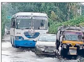
सिरसा। दड़बा कलां के पास बरसाती पानी में डूबी सड़क।