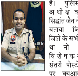
फतेहाबाद पुलिस द्वारा जनता से संवाद और जवाबदेही को मजबूत करने के उद्देश्य से शुरू की गई व्युत्थार कोड आधारित फीडबैक प्रणाली को आमजन से अत्यंत सकारात्मक प्रतिक्रिया प्राप्त हो रही है।

अब तक प्राप्त रिपोर्ट के अनुसार, 417 शिकायतकर्ताओं ने व्युत्थार कोड स्कैन कर पुलिस सेवा का फीडबैक दिया है, जिनमें से 96 फीसदी यानि 397 शिकायतकर्ताओं ने 5 स्टार रेटिंग देकर पुलिस व्यवस्था में अपने भरोसे को दर्शाया है।