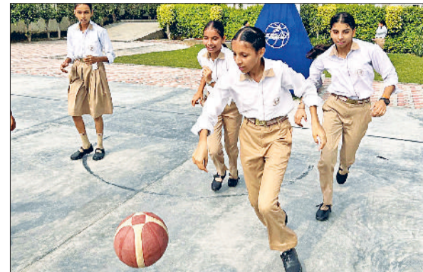
फतेहाबाद। क्रेसंट स्कूल में खेलते विद्यार्थी।