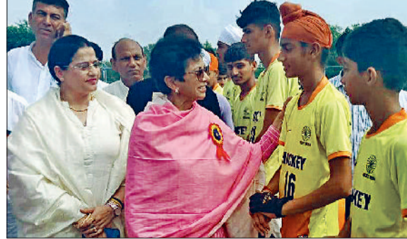
सिरसा। खेल दिवस पर शहीद भगत सिंह स्टेडियम में खिलाड़ी सांसद कुमारी सैलजा के साथ।

बावजूद वे तीन बार ओलंपिक में चमकते रहे। उन्होंने कहा कि खेलों से व्यक्तिगत विकास भी होता है और खेल हमें अनुशासन के साथ